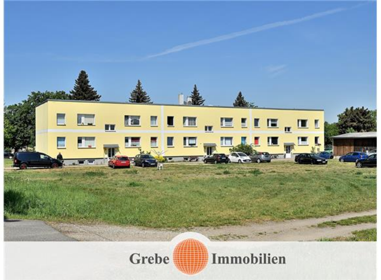
Jüterbog / Kloster Zinna