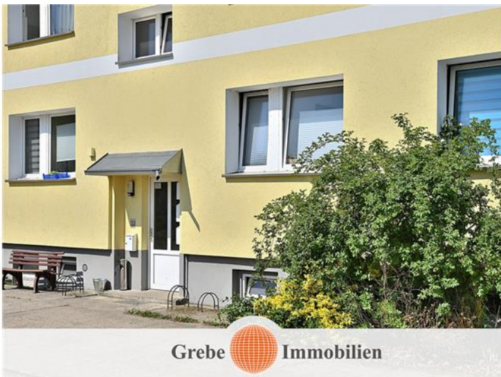
Modernisierung mit Vollwärmeschutz