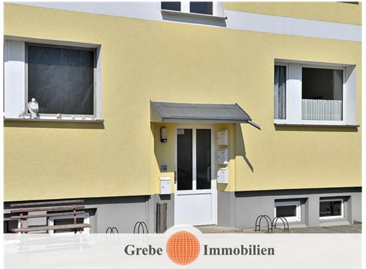
2 Etagen + Vollkeller